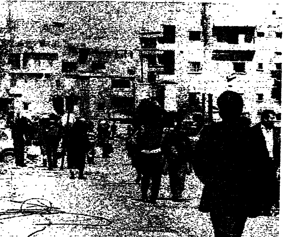
عابرون بما خلف حمله أو قتل